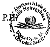
Lukács Bertalan igazgató